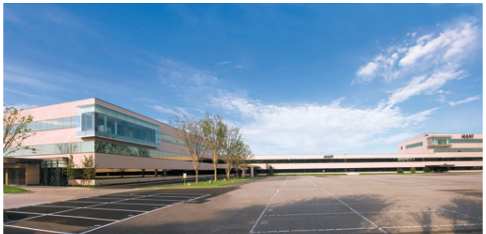
▲マニー(株) 清原工場 MANI KIYOHARA Factory