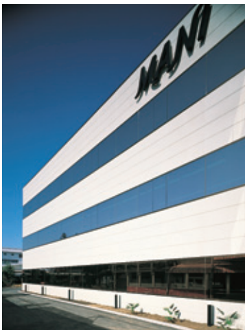
▲マニー(株) 高根沢工場 MANI TAKANEZAWA Factory